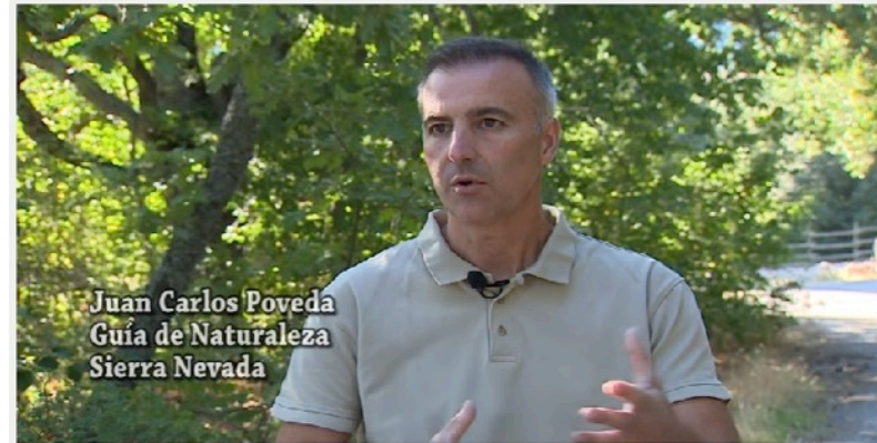
ECOTURISMO Y RED NATURA 2000