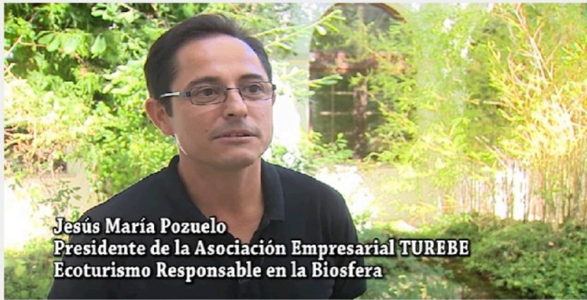
ECOTURISMO Y RED NATURA 2000